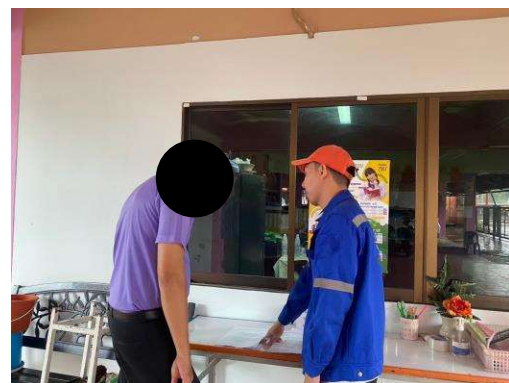
การสำรวจความคิดเห็นของหน่วยงานในพื้นที่โครงการในรัศมี ระยะ 5 กิโลเมตร รูปที่ 1-2 การประมวลภาพกิจกรรมการสำรวจสภาพเศรษฐกิจ-สังคม และความคิดเห็นของหน่วยงานราชการ ในพื้นที่ศึกษา ระหว่างวันที่ 4-10 ธันวาคม พ.ศ. 2567